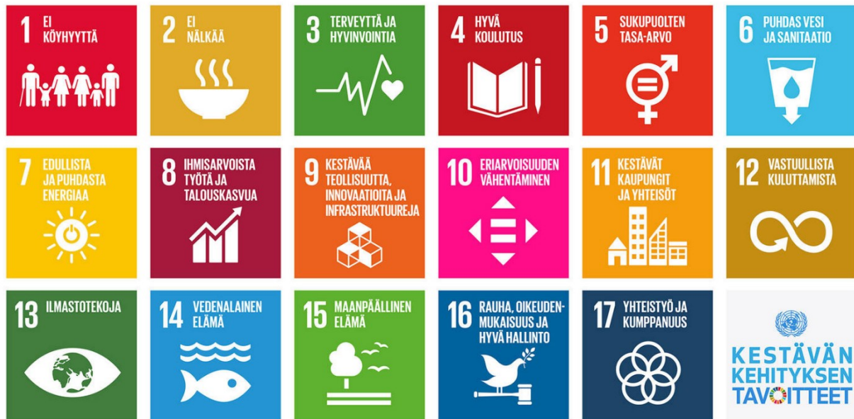
Kuva 3. Kestävän kehityksen tavoitteet. https://kestavakehitys.fi/agenda-2030 .

Tavoite 1: Kiinnittää huomiota erityisesti lapsiperheiden, yksinhuoltajien ja maahanmuuttajien suhteellisen köyhyyden mahdollisuuteen.