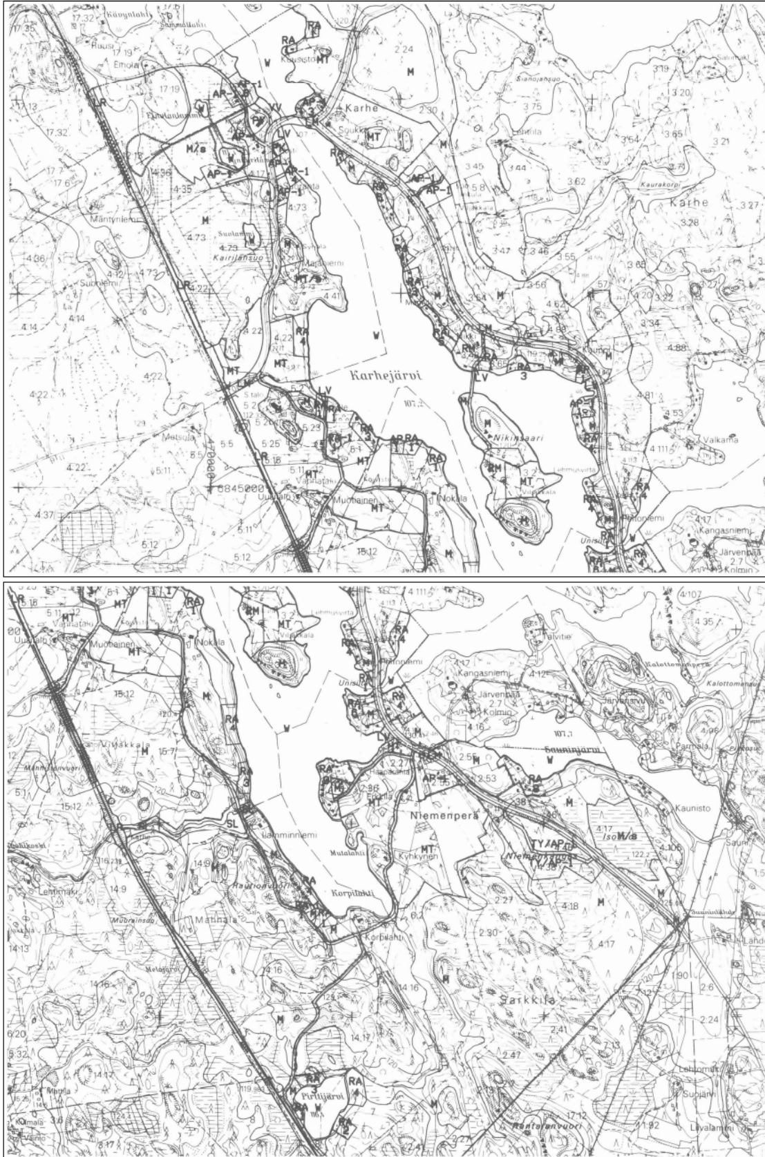
Kartat 1-2. Ote vuoden 1993 yleiskaavasta