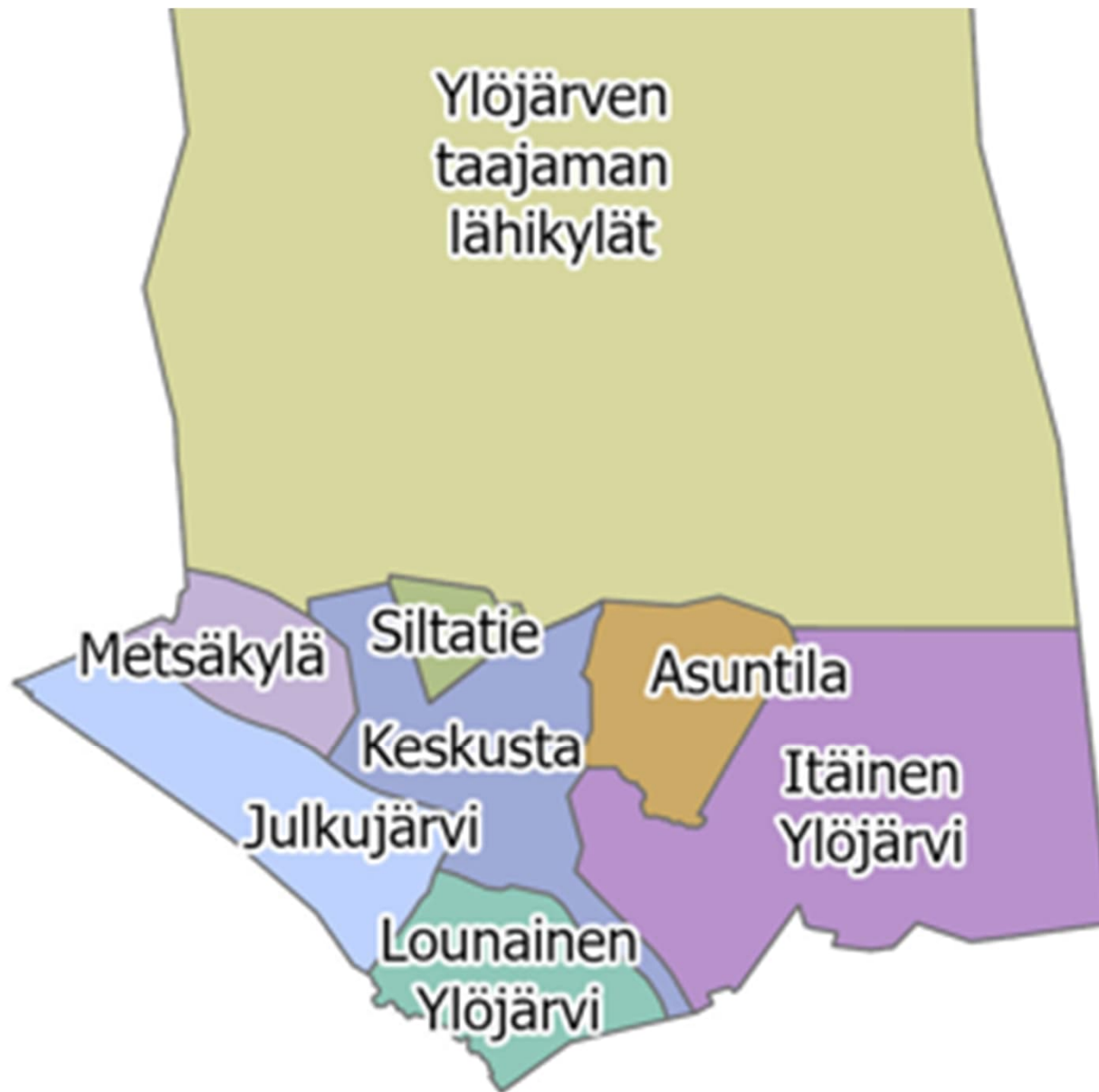
Ylöjärven eteläosan aluejako